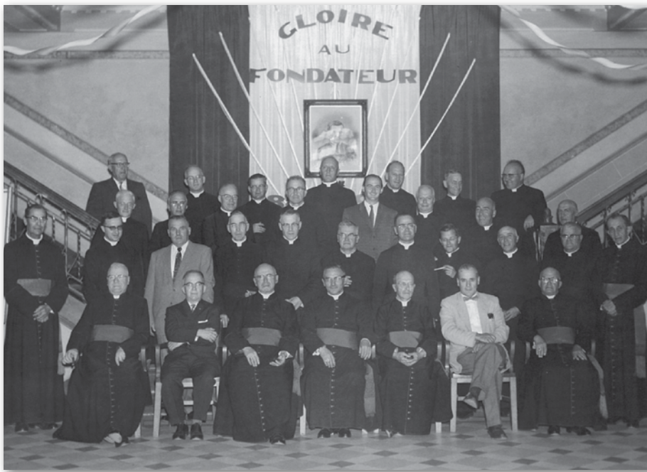
Année du centenaire, 1959.

En 1931, l'École étant redevenue à l'étroit, on demande l'ajout d'autres laboratoires. On en profite donc pour construire une autre aile au nord-est mesurant 106 pieds de long et prolongeant l'agrandissement de 1916. On décide également de fermer le carré en y érigeant une aile transversale à celle-ci mesurant 85 pieds de long. Dans cette aile, on trouve la nouvelle entrée de l'École, la bibliothèque, de nouveaux laboratoires ainsi que l'amphithéâtre. Ce sont 90 chambres disponibles pour les pensionnaires, et on peut désormais accueillir entre 200 et 225 élèves.