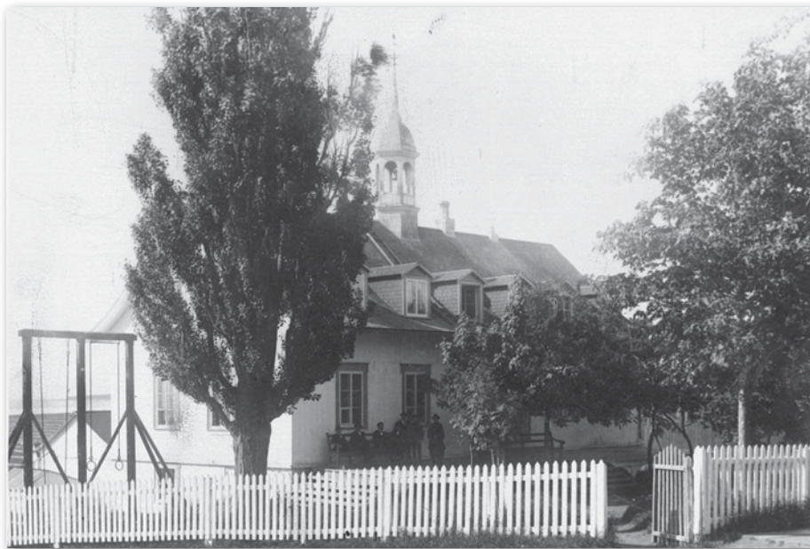
L'École d'agriculture, vers 1900.